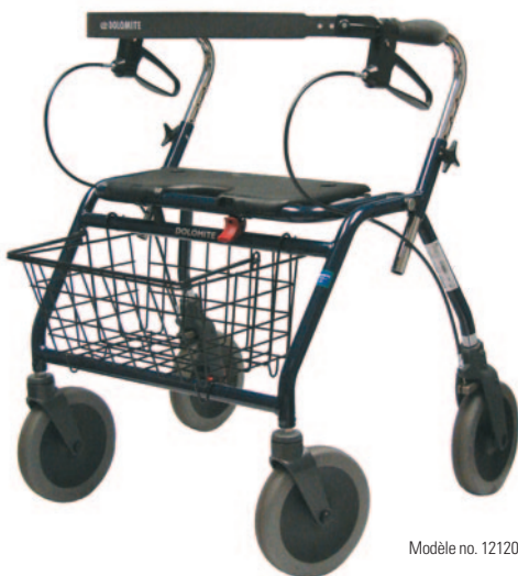
Modèle no. 12120-37-746