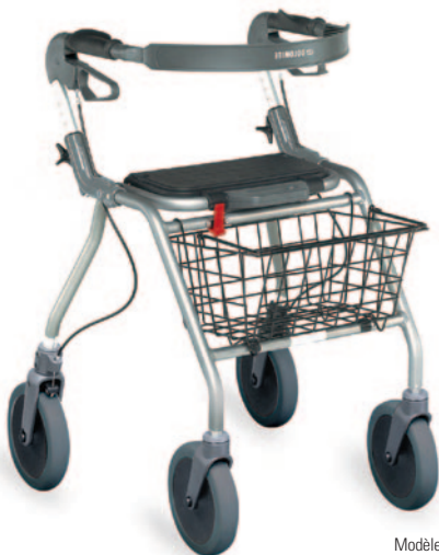
Modèle no. 12160