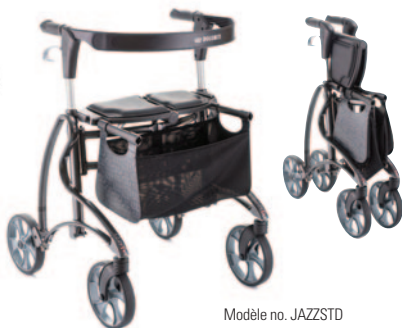
Modèle no. JAZZSTD